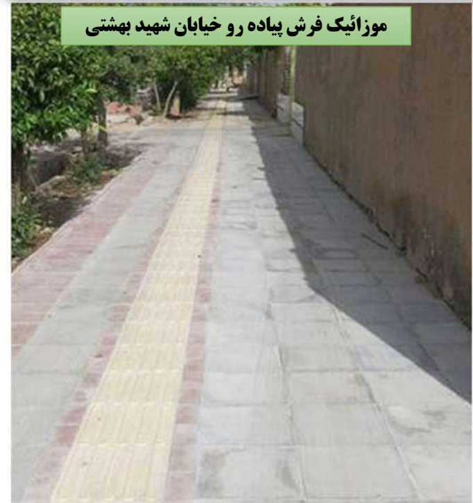
موزائیک فرش پیاده رو خیابان شهید بهشتی