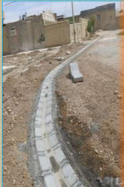
اجرای کانپو کوچه ۱۹ منشعب از خیابان جمهوری و کوچه ۷ منشعب از خیابان شهید بهشتی