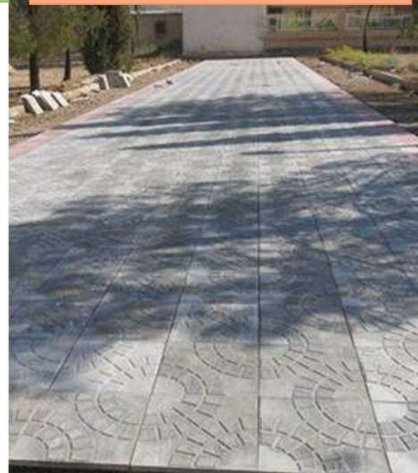
موزائیک فرش پارک شهدای عشایر