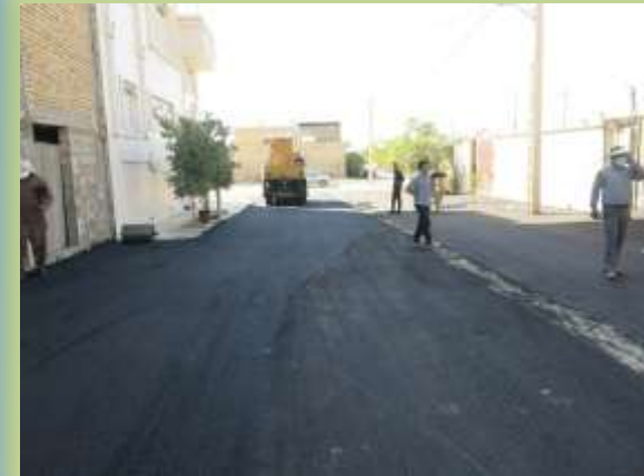
عملیات پخش آسفالت معابر شهرک جهاد , شهرک استقلال و کوچه منشعب از بلوار امیر کبیر