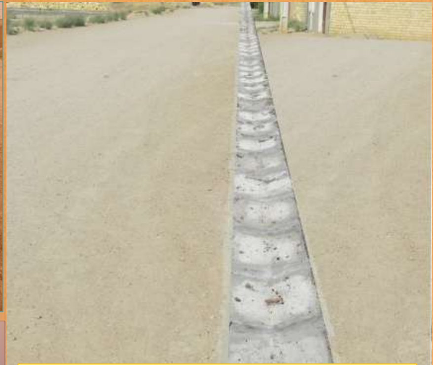
اجرای کانپو کوچه منشعب از خیابان پیروزی