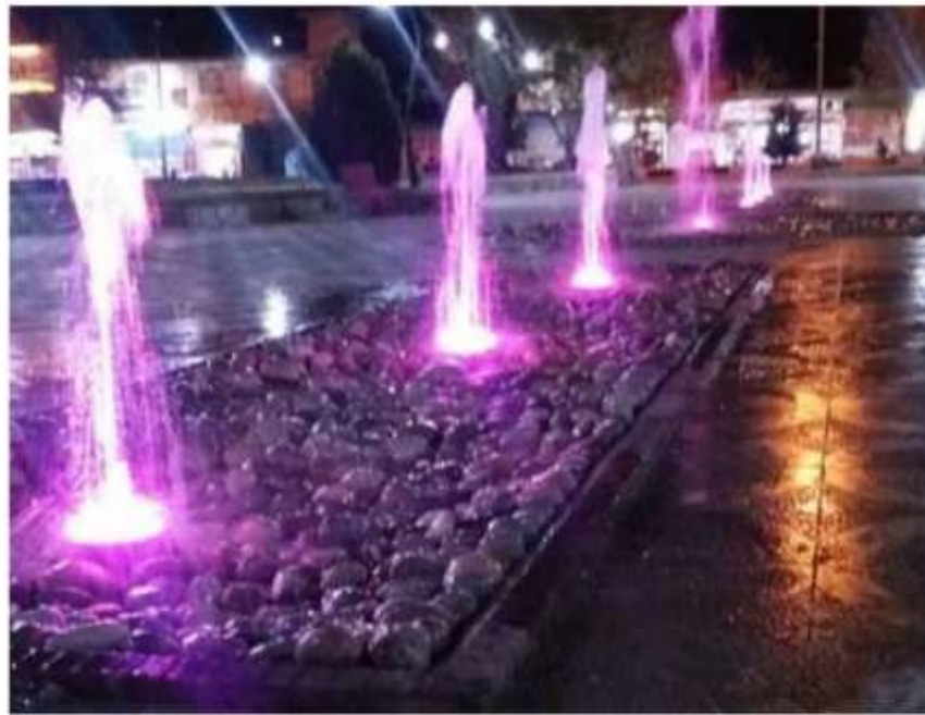
ساخت آب خوری پارک جوان