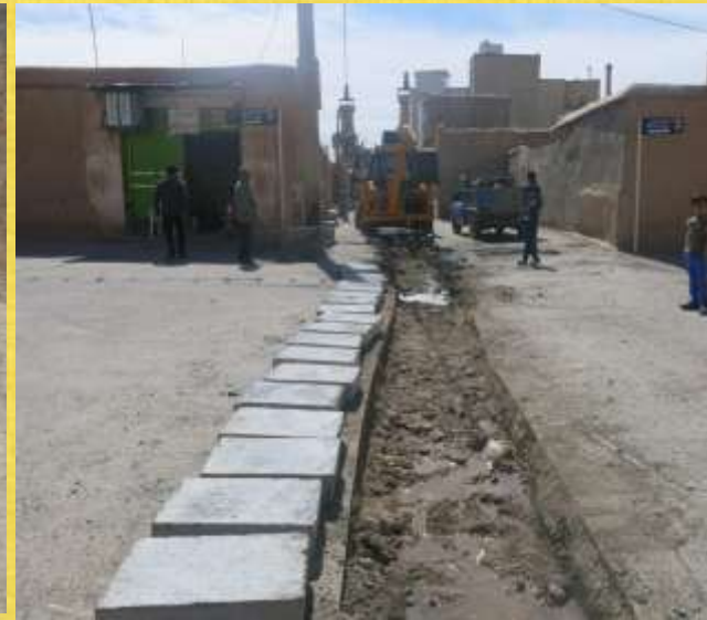
اجرای کانپو و زیرسازی کوچه جنب بانک کشاورزی