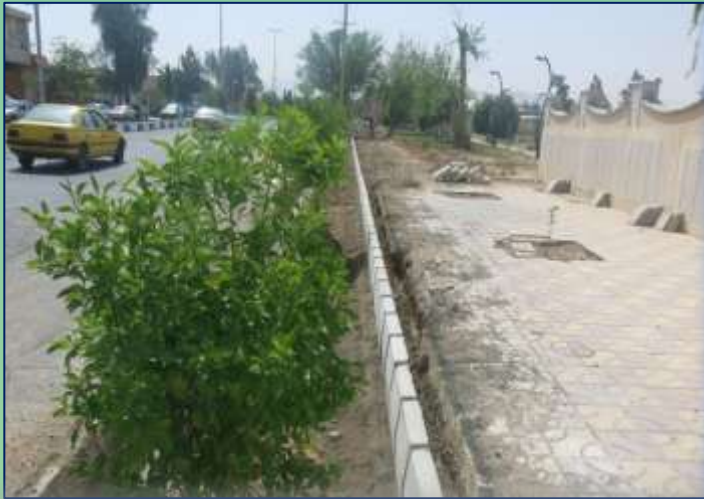
اجرای تک لبه پیاده رو پارک جوان