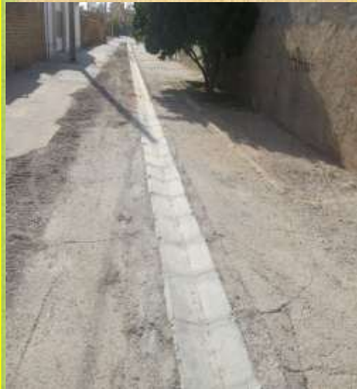
اجرای کانپو و زیرسازی کوچه جنب مخابرات