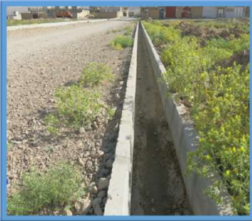
اجرای جدولگذاری خیابان منشعب از بلوار سرداران