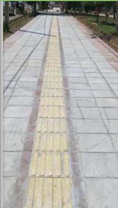
موزائیک فرش پیاده رو پارک جوان