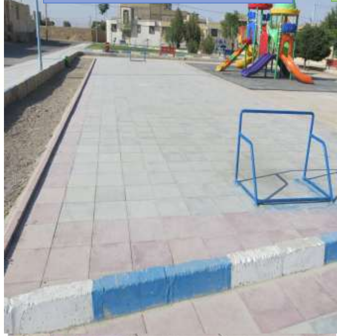
موزائیک فرش پارک شهیدان گلی