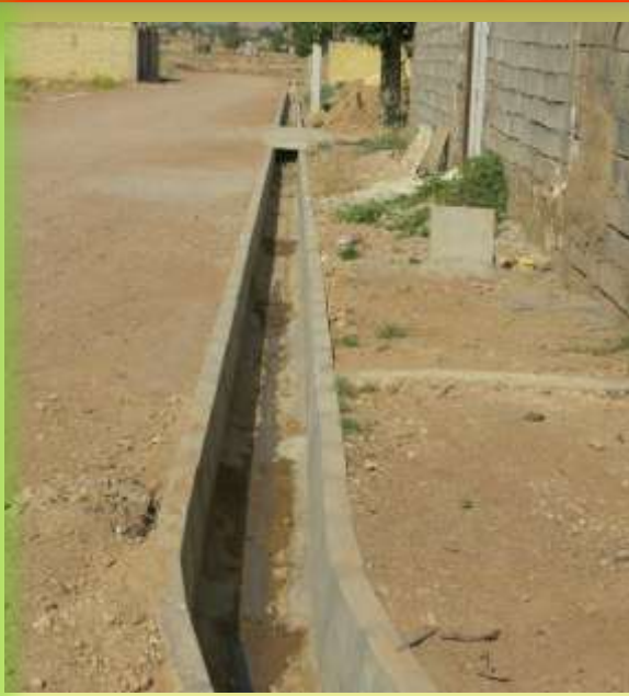
اجرای جدولگذاری انتهای بلوار امام علی (ع)