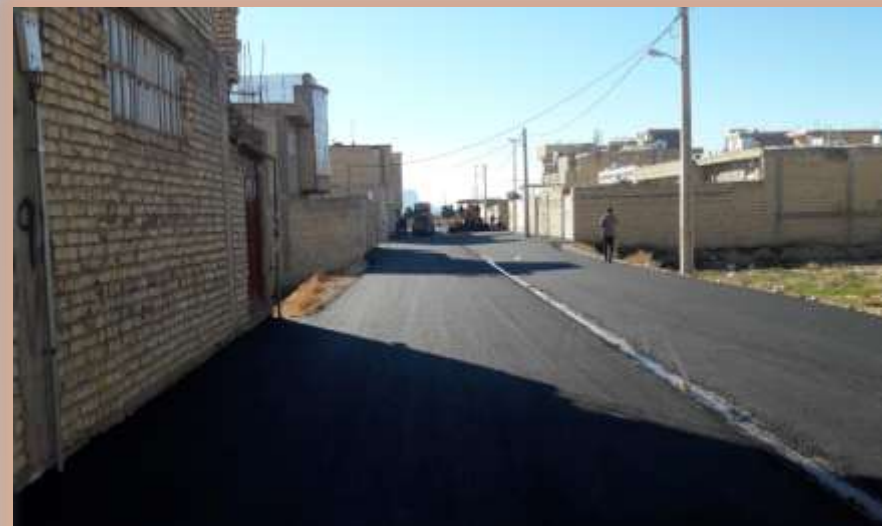
عملیات پخش آسفالت خیابان کارگر