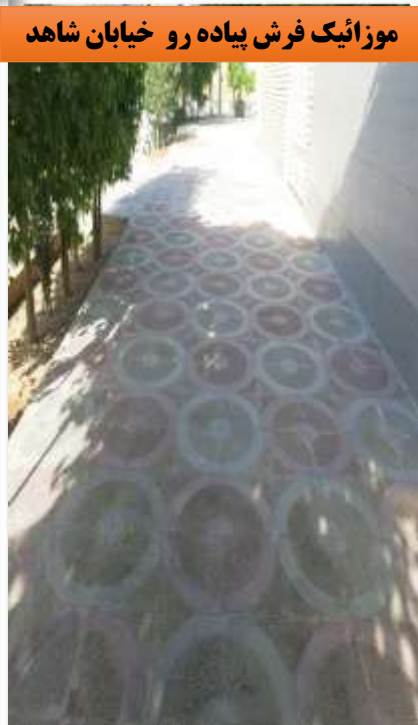
موزائیک فرش پیاده رو خیابان شامد